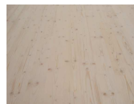
VI – Qualità a vista abitativa